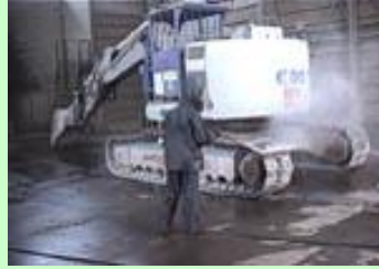
建機用洗浄ホースに！！