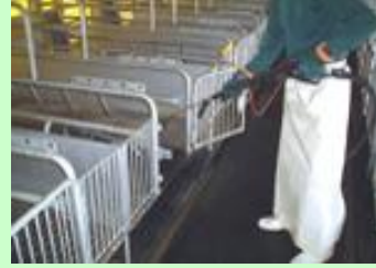
農畜産業の清掃用洗浄ホースに！