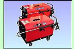
あらゆるメーカーの高圧洗浄機のホースに対応いたします。