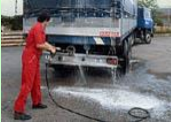
車両洗浄用のホースに！！