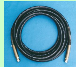
ぜひともご用命下さい。